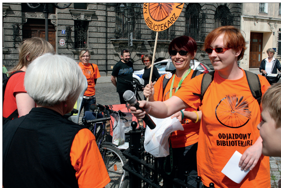
Ryc. 2. „Szczeciński Odjazdowy Bibliotekarz 2013”. Plac Orła Białego w Szczecinie. Wręczenie nagrody za rozwiązanie pierwszej zagadki literackiej.